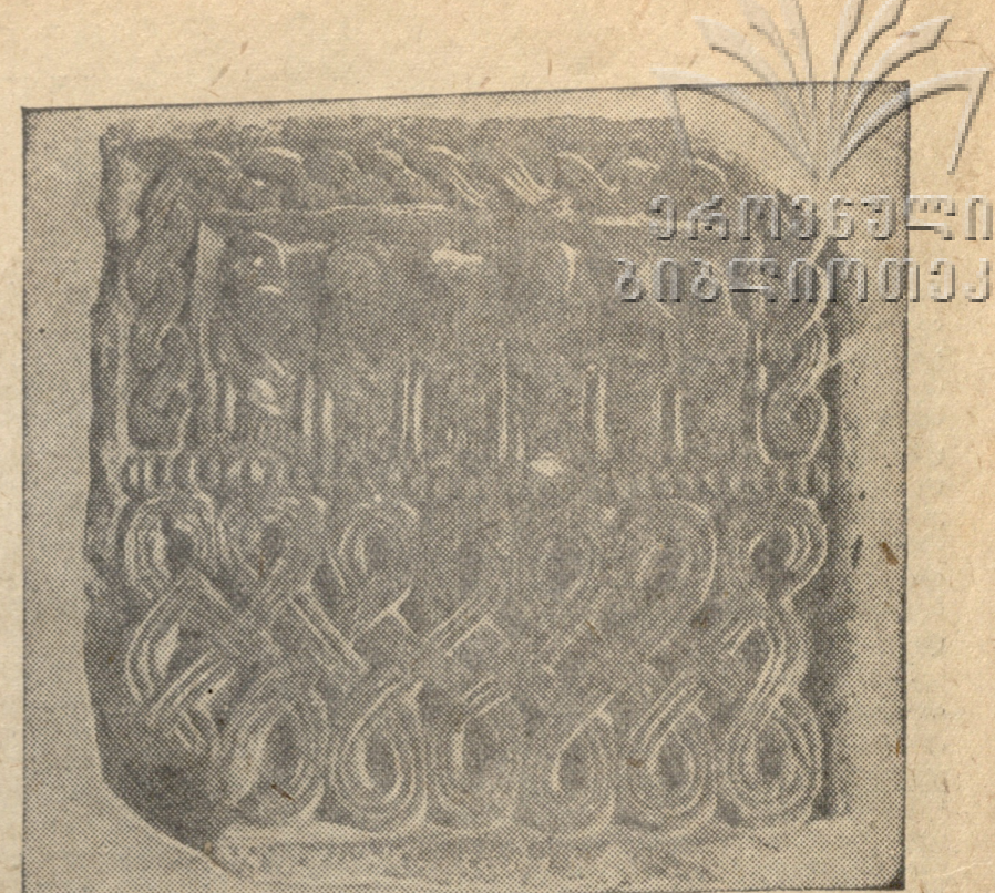
სამწიფისიდან ჩამოგანილი მოჭურვებული ავარი შოთა რუსთაველის ეპიკა გამოცემის მასალიდან