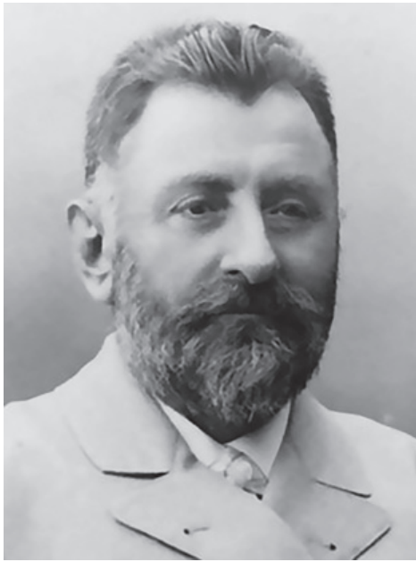
თარიღები, რომელიც უნდა ვიცოდეთ: 1831 წელს დაიბადა იაკობ გოგებაშვილი.

1901 წელს სოფელ ვარიანში, გოგებაშვილის სახლის ერთ პატარა ოთახში, რომელიც თავად იაკობს ეკუთვნოდა, მისივე ინიციატივით სოფლის გლეხების შვილებისათვის სკოლა გაიხსნა.