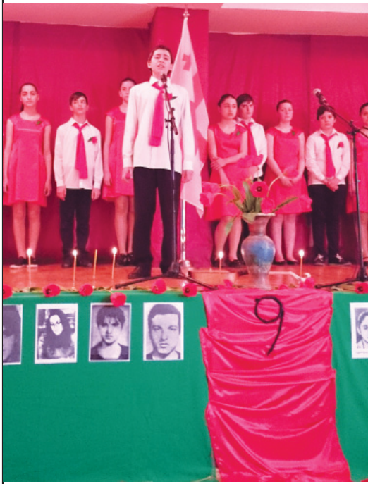
▶▶ გაგრძელება მე — 2 გვ.