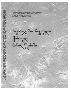
სავარჯიშო რვეული პირველი გარემოსთვის

წიგნი I კვლი ძველ მწერლებზე; წიგნი II „ვეფხისტყაოსანი“; წიგნი III XIX საუკუნის მწერლები; წიგნი IV XX საუკუნის მწერლები