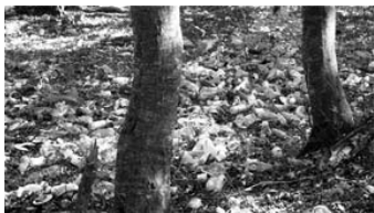
ეს კი საქართველოს ტყეა.

ამიტომაც იაპონიაში ვერსად ნახავთ დანაგვიანებულ ქალაქსა თუ მის შემოგარენს.