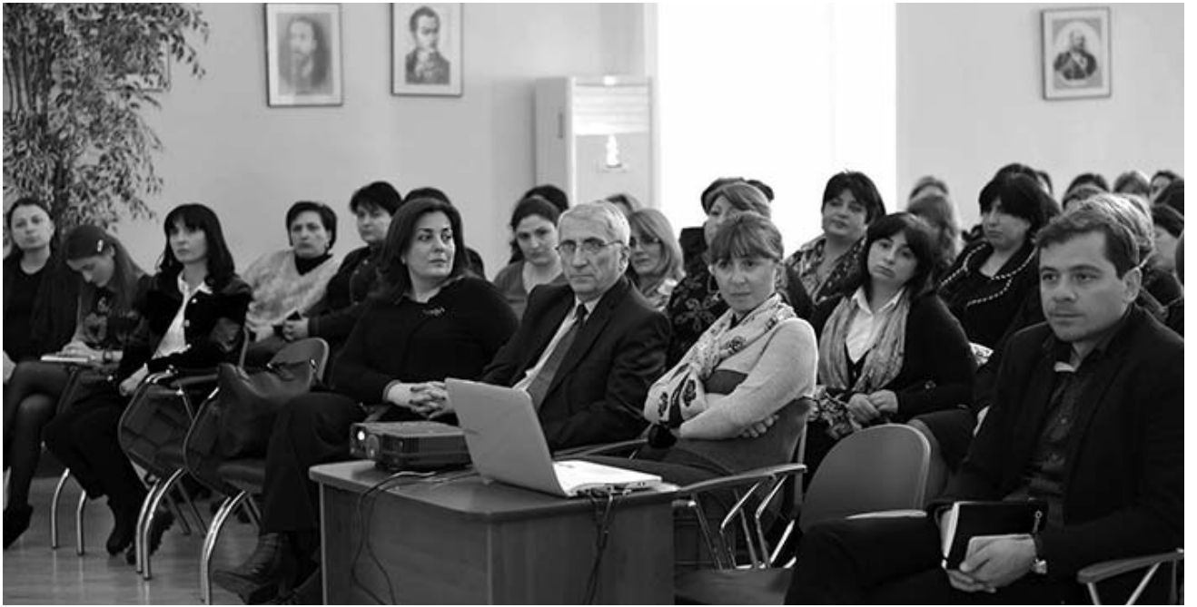
საქმიანობა და მეორე – ამით საზოგადოებასაც და სახელმწიფოსაც მიეცეს საშუალება, ობიექტურად შეაფასოს მასწავლებელი, დაინახოს მისი საქმიანობის როგორც დადებითი, ისე პრობლემური მხარეები და მიიღოს შესაბამისი გადაწყვეტილებები.“

სქემა რამდენიმე მიმართულებითაა მნიშვნელოვანი: ერთი – მასწავლებელმა კარგად გაიაზროს თავისი პროფესიული