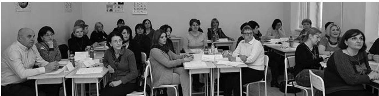
მასალა მოამზადა ლალი თვალაპაიშვილმა

რაც მთავარია, ეს არ არის ჩასაფრების პოლიტიკა, პირიქით – ძალიან კონსტრუქციული უკუკავშირი იმისთვის, რომ მასწავლებლებს ეფექტური რეკომენდაციები მიეცეს – სად აქვს მას ძლიერი თუ სუსტი მხარეები. საკუთარი პრაქტიკის თვითშეფასების შედეგად, მასწავლებლებმა, თავიანთი ძლიერი და სუსტი მხარეების რეფლექსია მოახდინეს და ამის გათვალისწინებით დაგვემეს პროფესიული განვითარების ინდივიდუალური გეგმები. უკუკავშირი, იქნება ეს სკოლის შიდა შეფასების ჯგუფის თუ ეგრე დაკვირვების ჯგუფის მიერ განხორციელებული, ვფიქრობ, მასწავლებლებს ძალიან ნაადრევად პროფესიული კვალიფიკაციის ამაღლებაში. სახელმწიფო, თავის მხრივ, სხვადასხვა საშუალებებს სთავაზობს პედაგოგს, იქნება ეს ტრენინგები, სასწავლო მასალა, ლიტერატურისა და რესურსის სახით თუ სხვ. რაც ყველაზე მნიშვნელოვანია, სწორი აქცენტი გაკეთდა, როდესაც ადგილებზე დაიწყო ურთიერთთანამშრომლობა და ურთიერთშეფასება. ამით სავსებრივ კათედრებსაც მეტი დატვირთვა და მნიშვნელობა მიეცა. ადრე ეს პროცესი ფორმალურ ხასიათს ატარებდა, ახლა რეალურად თანამშრომლობენ, ესწრაფებიან ერთმანეთის გაკვეთილებს და ეს პროცესი ძალიან ეფექტურად მიმდინარეობს.“