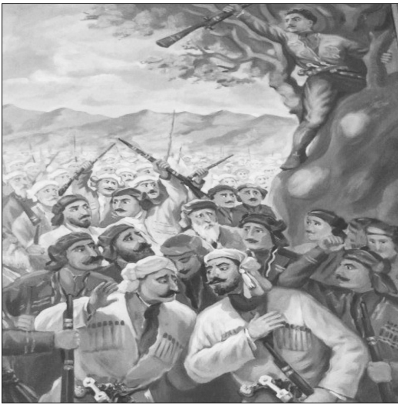
„გურია აბუნტაშულა ალარ მოსწონს კმელი ფისი“ ხალხური