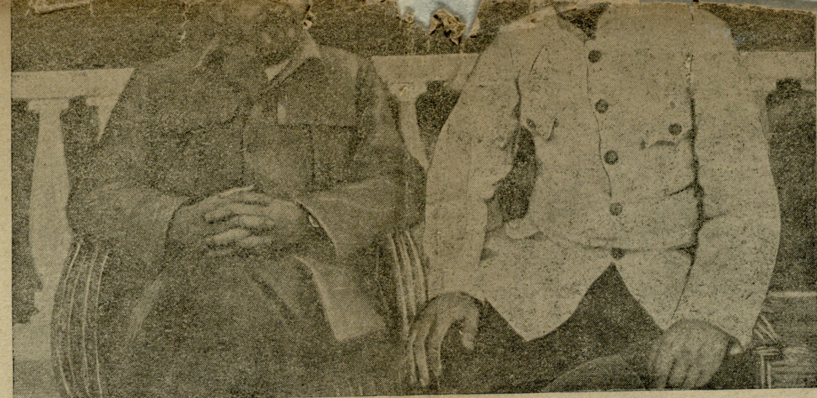
ლენინი და სტალინი