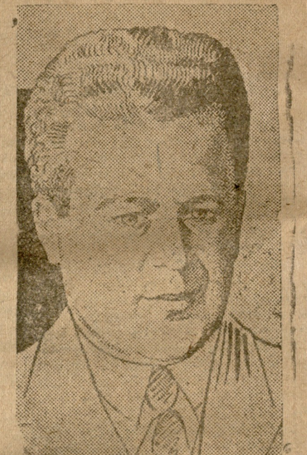
გის საბარში მწერლებთან, უფლებები გა...