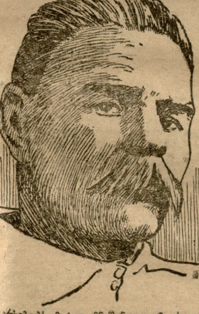
ბალახტიონ ტაბიძის ფოტოგრაფია.

ბალახტიონის პოეზია განსაკუთრებით გამოირჩევა თავისი სიმბოლურობითა და ფორმალური სილამაზით. მისი ნაწარმოებებიდან აღსანიშნავია „მედიტაციები“ და „სიმბოლოები“.