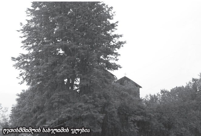
ღვთისმშობლის სახელობის ეკლესია

ნაკაშიძეები გურიაში XIII საუკუნის პირველ ნახევარში ქართლიდან მოსულან, მაგრამ ვახუშტი ბატონიშვილი ნაკაშიძეებს გურიის ადგილობრივ, მკვიდრ თავადებად თვლის და ამ ქვეყნის ზოგიერთი თავადური გვარის (ამილახვრები, შარვაშიძეები, თავდგირიძეები) სხვა კუთხებიდან წარმომავლობაზე მიგვიჩვენებს. გვარის ეტიმოლოგიაზე არსებობს მეცნიერთა სხვა მოსაზრებაც – გვარი ნაკაშიძის ძირია „ნაკა“, რაც მეგრულად „ვაკეს“, „მინდორს“ ნიშნავს. იგი ლაზურ (ჭანურ) კილოკავშიც დასტურდება. ნაკაშიძეთა გვარი დოკუმენტურ წყაროებში XVI-ე საუკუნეში ჩნდება. სათავადოც ამავე საუკუნეში ყალიბდება. გურიაში ვრცელ