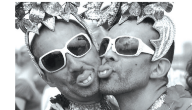
ინი არც საზოგადოებას აწვალდებდნენ, არც ქვეყანას და არც სამშობლოს.

რაღა შორს წავიდეთ, სურამის ფსიქიატრიულ საავადმყოფოში სხვადასხვა წლებში მყურნალობდნენ სტალინი, სტალინის შვილი, კენედი, ალექსანდრე მაკედონელი, მოლოტოვი და სხვაც ბევრი... ისინი პირდაპირ აცხადებდნენ, რომ სწორედ ზემოჩამოთვლილი პიროვნებები იყვნენ და, ფაქტობრივად, არც არსებობდა არგუმენტი, რომ მათთვის ეს გადაეთქმევიანათ. იყვნენ და მორჩა! ისინი არც საზოგადოებას აწვალდებდნენ, არც ქვეყანას და არც სამშობლოს.