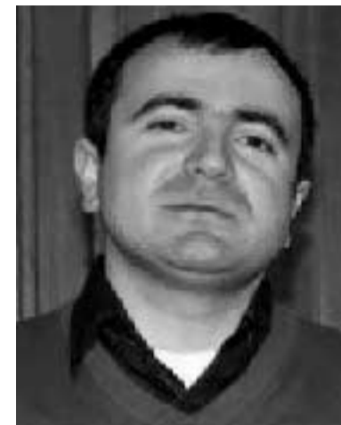
ვაში, ჩვენ, უფლებადამცველები, რომელთა პირდაპირი მოვალეობაა ადამიანთა უფლებების დაცვა, ვეღარ შეგვძლებს ჩვენი საქმიანობის აღსრულებას.