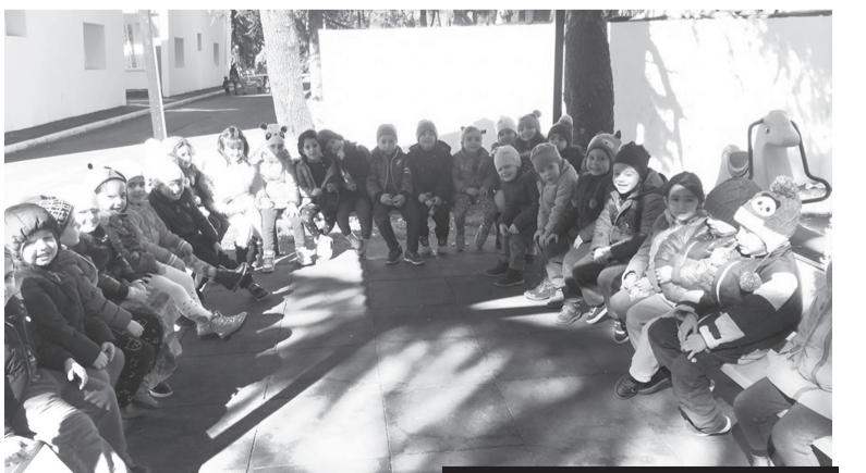
გაბრკელება მე-2 გვ.