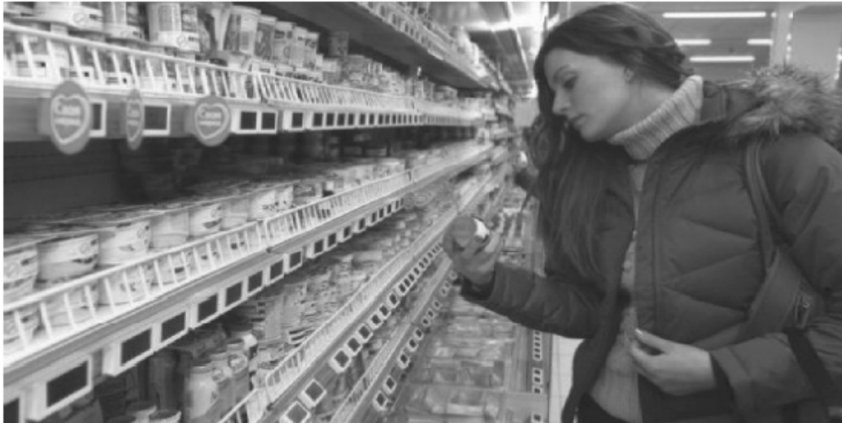
მომხმარებელი კანონპროექტის განხილვაში აქტიურად უნდა ჩაერთოს.

კანონპროექტში მოცემულია სა მომხმარებლისათვის სასაქონლო ბიზნესობიექტების ვალდებულება, რომ მომხმარებელს გადასცეს ხელშეკრულების შესაბამისი