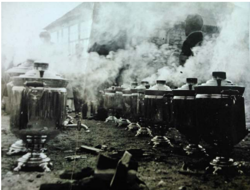
На фото: кипятят самовары к свадебному столу

нарушения Божьих заповедей и нашего обещания, между нами была соблюдена верность и ложе, удаляться от всякого блуда и прелюбодеяния до скончания дней нашей жизни. Аминь.»