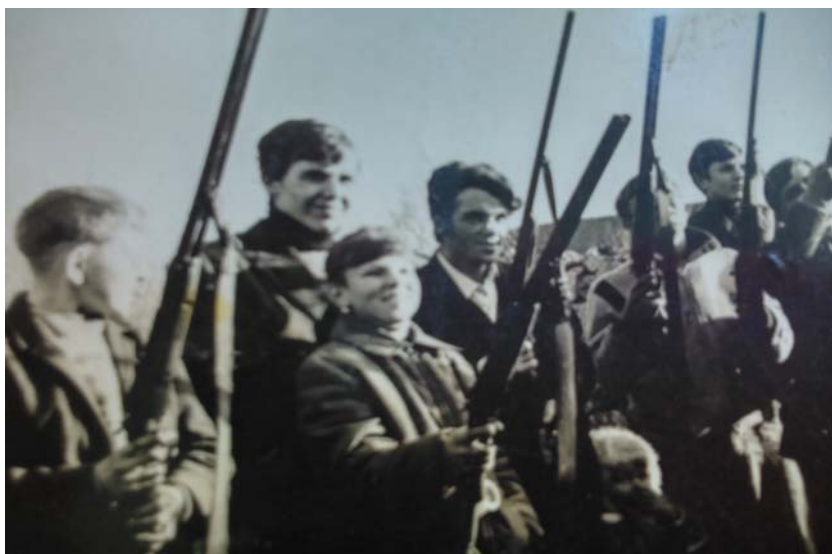
На фото: палят из ружей в честь празднования свадьбы

Третий день - день смотрин, родственники невесты идут в дом жениха, где «молодая» демонстрирует все подарки, которыми одаряют приглашенные гости в день свадьбы. Затем идет их угощение.