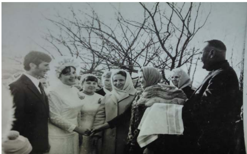
На фото: молоканская свадьба в с. Красногорка

Религиозный обряд бракосочетания выглядит следующим образом: перед вступлением в брак каждый из брачующихся благословляется своими родителями или воспитателями. Для этого собираются родные и молятся: Во имя Отца и Сына и святого духа, Аминь; Отче наш - до конца; Се ныне благословите Господа. После этого благословляемый (жених, невеста) целуется с родителями, становится на колени, а родители возлагают ему руки на головы и благословляют, говоря следующее: «Будь, чадо наше, благословенно Всевышним. Да благословит тебя Господь от Сиона, и увидишь блага Иерусалима, во все дни жизни твоей, и увидишь сыновей сынов твоих».