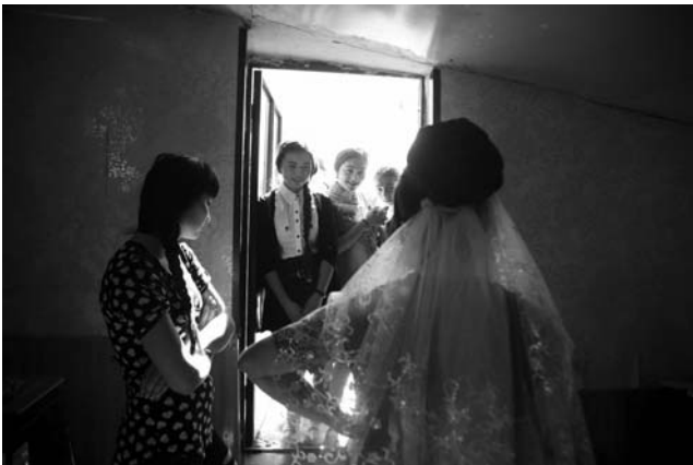
ნორჩი პატარძალი საქორწილო კაბას აჩვენებს თანაკლასელებს