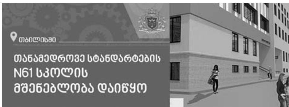
თბილისში თანამედროვე სტანდარტების N61 სკოლის მშენებლობა დაიწყო