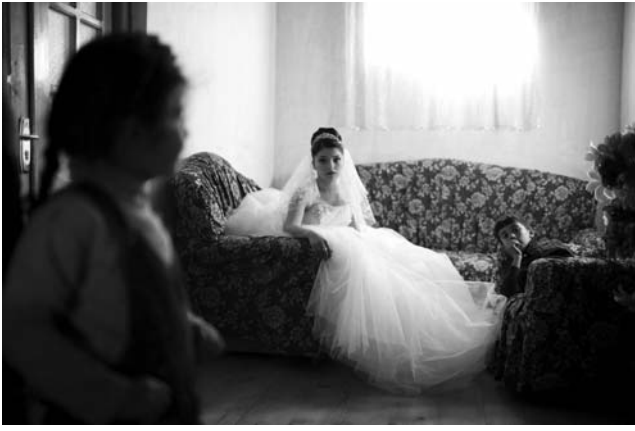
ნორჩი პატარძალი თავის სახლში ელოდება სიძეს