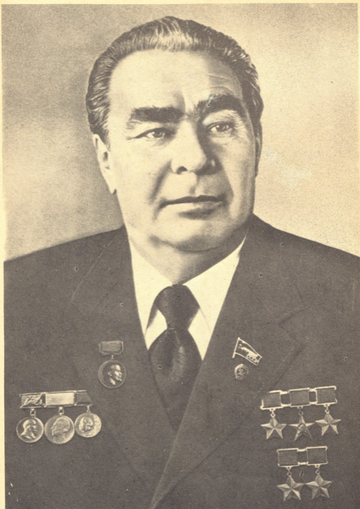
ლეონიდ ილიას ძე ბრეჟნევი