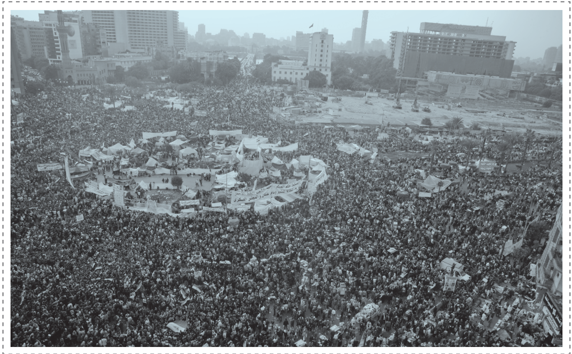
ილუსტრაცია 8. საპროტესტო ბქცია თაპრირის ზოეღანზე (კაირი, ეგვიპტე).