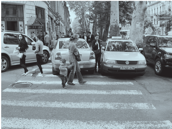
ილუსტრაცია 6. საპროტესტო აქცია გულიაშვილის მოედანზე (თბილისი).