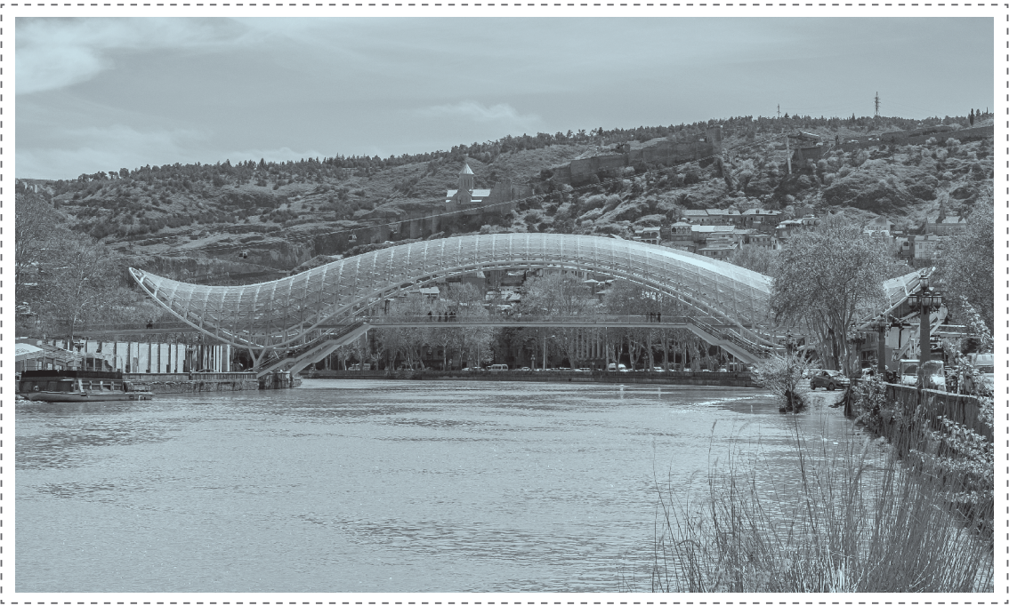
ილუსტრაცია 16. თბილისი. „მშვიდობის ხატი“.