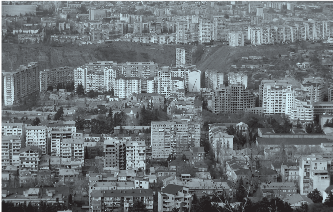
ილუსტრაცია 12. თბილისი, საცხოვრებელი განაშენიანება.