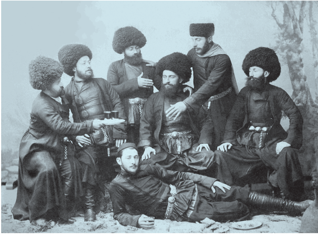
ილუსტრაცია 3. გფილისელი ყარაჩოღლები.