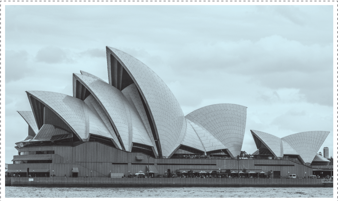
ილუსტრაცია 15. სიდნეის ოპერა (ავსტრალია).