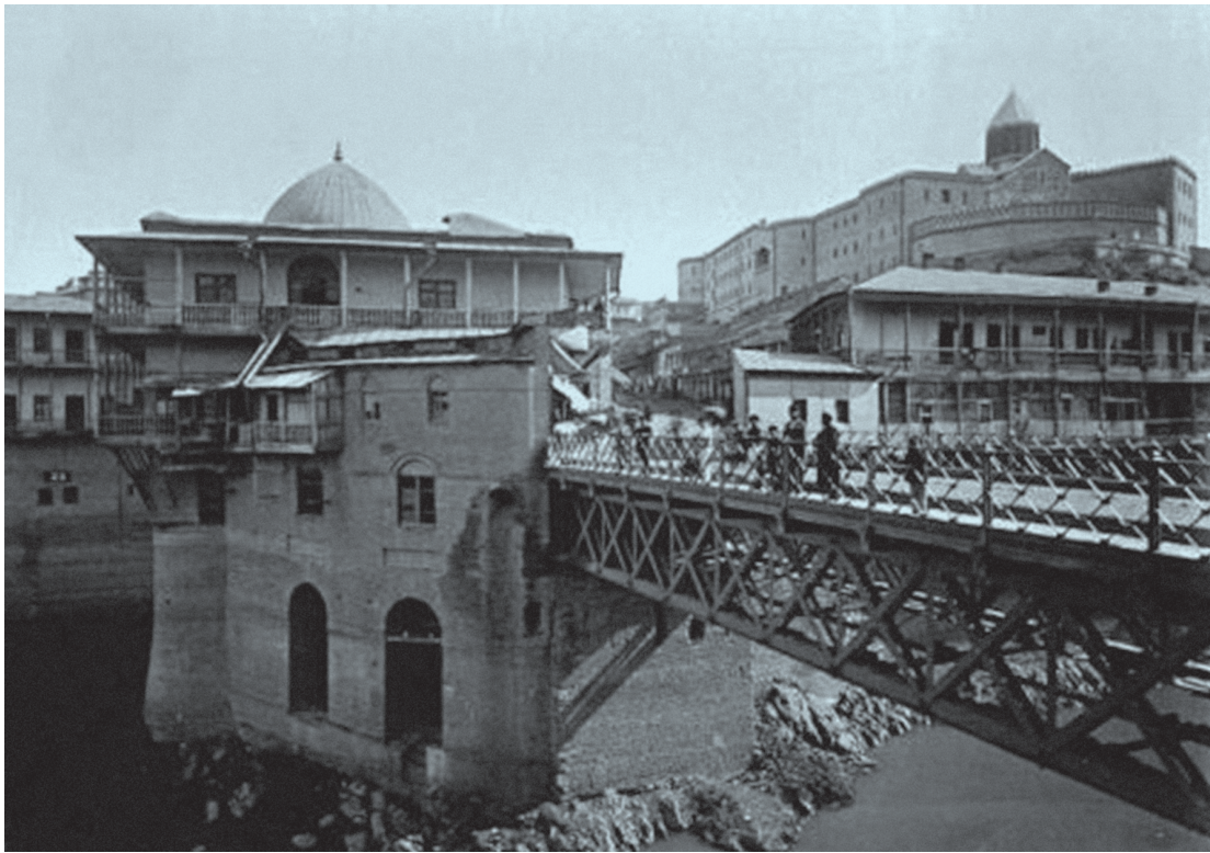
ილუსტრაცია 2. აელაბრის ახალი ხიდი, მეგეხის ციხე და გუბალაშვილების ქარვასლა (დანგრეულია 1940 წელს).