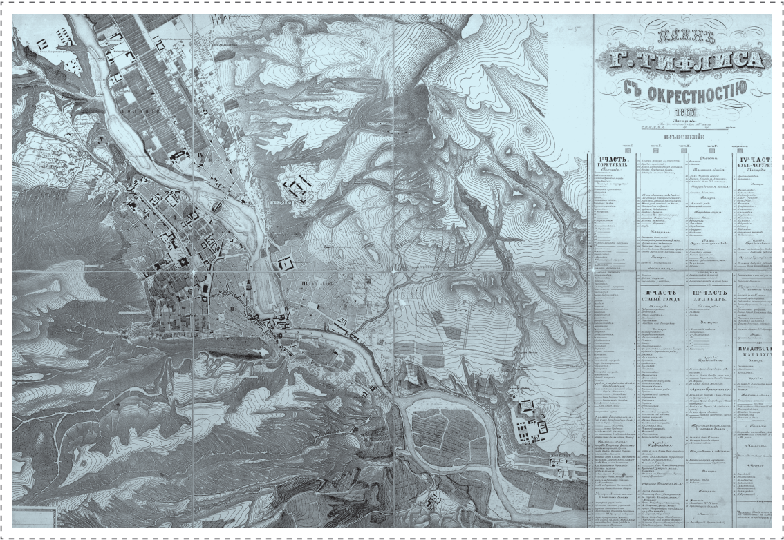
ილუსტრაცია 1. ქალაქ გოლისის და მისი შემოგარენის გეგმა. 1867 წ.