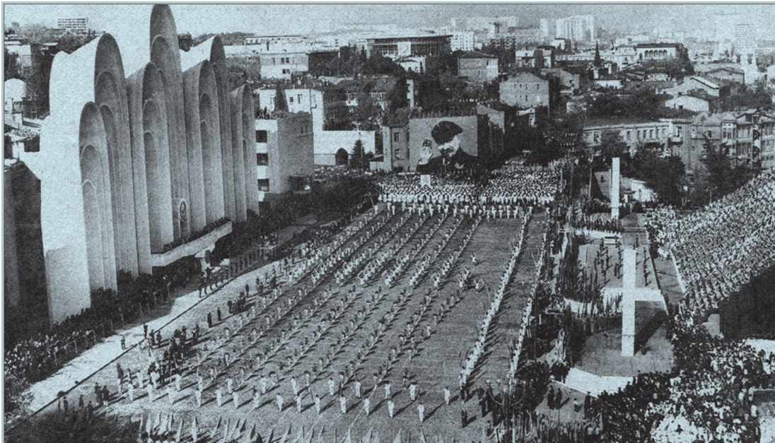
საქართველოს დედაქალაქის შრომითი დიდების, მისი გამრჯე, ალალი მარჯვენის, მისი ინტელექტისა და ტალანტის, ჭაღარა წარსულისა და საგმიროდ შემართებული სიტაბუკის გამოშაატველი იყო თბილისის შრომელთა ასიათასიანი დემონსტრაცია რესპუბლიკის დედამოედანზე.

ილუსტრაცია 5. ალლუმი საგანგებოდ დაპროექტებულ რესპუბლიკის მოედანზე (თბილისი).