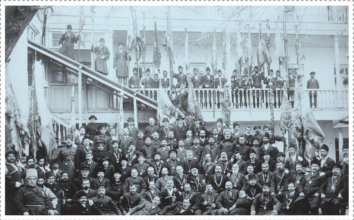
ილუსტრაცია 4. გვილისური აშქარი.