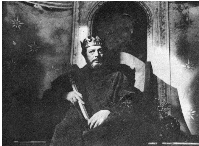
მარჩელო მასტროიანი („ჰაინრიხ მეოთხე“)

ერთ მშვენიერ დღეს ბელკრედი, მათილდა, მისი ასული ფრიდა, რომელიც ძალზე წააგავს დედას ახალგაზრდობაში, და მოსყიდული ექიმი-ფსიქიატრი ჩადიან „ჰაინრიხ მეოთხესთან“, რათა შეთხზული სპექტაკლით