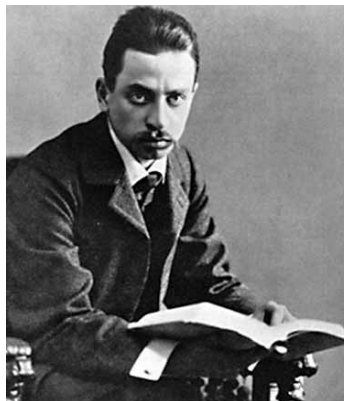
რაინერ მარია რილკე

ბატონ რილკეს იმხანად მხოლოდ როდენის მდივანად ვიცნობდი. დიდი ხნის შემდეგ პირველად ბლევ სანდრარმა შემიღო რილკეს სამყაროს კარი და მაშინ მომაგონდა