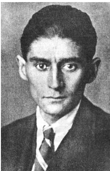
ფრანც კაფკას უკანასკნელი ფოტო

„პროცესის“ არგუმენტი გამყინავად მარტივია. ერთ დილას იოზეფ კ.-ს აპატიმრებენ. იგი შეიტყობს, რომ ამერიდან პროცესის საგანს წარმოადგენს, ანდა გერმანული შესატყვისიდან გამომდინარე, იურიდიული „პროცესისა“. მისი დანაშაული არ არის არც კრიმინალური, არც პოლიტიკური და არც რელიგიური ხასიათისა. ეს დანაშაული საიდუმლოდ რჩება. იქნებ იგი იმიტომ დაამნაშავე, რომ ებრაელია? ვაჟიშვილი? გაუბედავი საყვარელი? ყოველივე ამისა და ბევრ სხვა რამის გამოც. სწორედ ესაა პრალელი წერილი სადაზღვევო მოხელის გენიალური მიხვედრა, იმ მოხელისა, რომელიც კაფეებისა და ლიტერატურული წრეების მუდმივი სტუმარია და გარშემომყოფთა მოხიბლვა ძალუძს, რადგან მისი საუბარი ყოველთვის უჩვეულოდ სიღრმისეულია და შავ-ბნელი იუმორით შეკაზმული. მაგრამ არავინ არაფერი იცის მისი გაცხარებული ლამეული მუშაობის შესახებ იმ ოთახებში, რომლებიც მისი ოჯახის მიერ ერთიმეორის მიყოლებით გამოცვლილ ბინებში მდებარეობს. აქ იგი ოცდაათ ნელს გადაცილებული კვლავაც მარტოხელად რჩება, რადგან,