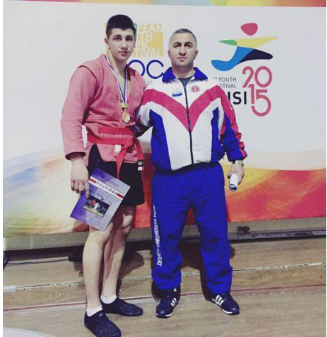
სურვეთ წარმატებებს მომავალ ასპარეზობებში.

27-28 თებერვალს ქ.თბილისში გაიმართა, საქართველოს ჩემპიონატი ახალგაზრდებს შორის, ჭიდაობა სამბოში.