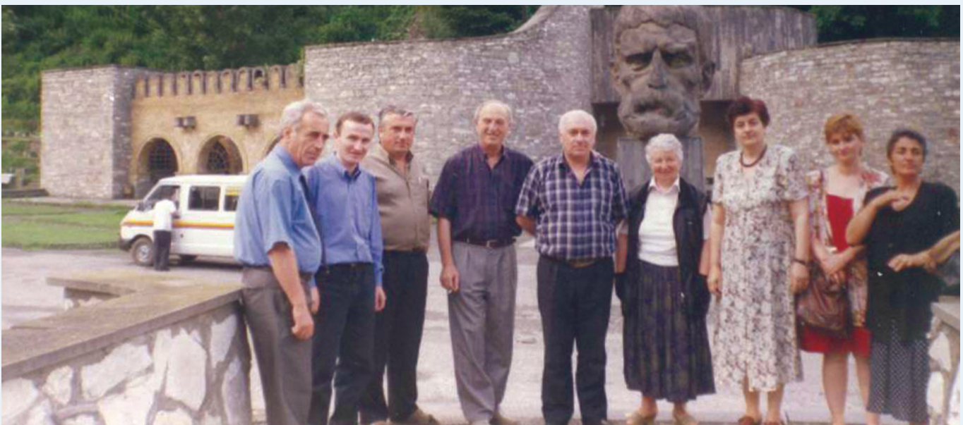
ჩარგალში. 1999 წ. 3 ივლისი