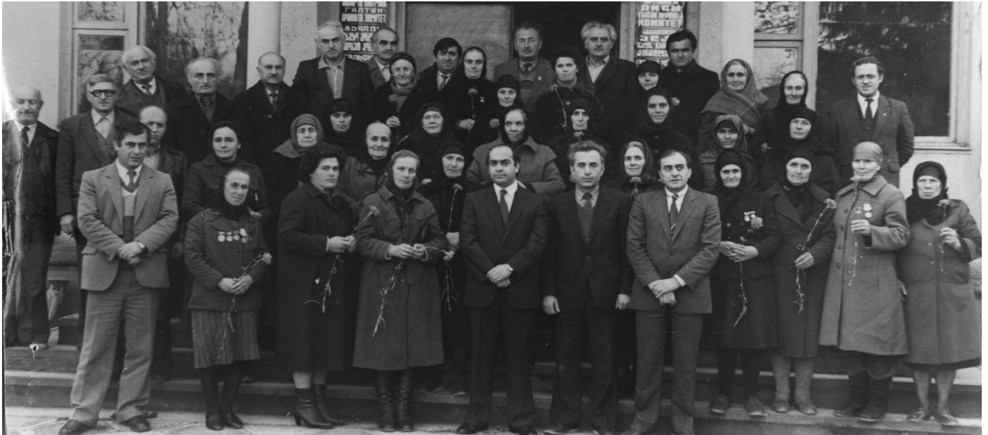
გალის რაიონის გამგეობა, 8 მარტთან დაკავშირებული შეხვედრა. 1988 წ.