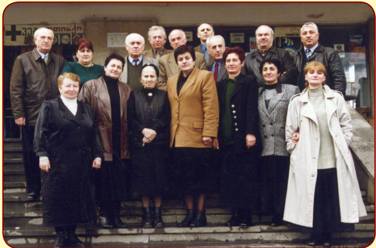
გალის რაიონის გამგეობის მუშაკთა თბილისის ვგუფი. 2001 წლის 21 მარტი