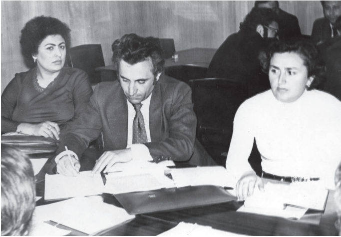
ბაქო. სამართლებრივი სკოლის სემინარზე

ტებით ჰქონდა დასაბუთებული, რომ ვერ შებედეს რაიმე შეეცვალათ. ზენარჩინებული სწავლის გამო მისი სურათი ყოველთვის საპატიო დაფაზე გახლდათ გამოკრული და სასწავლებლიდან ჩვენი წამოსვლის შემდეგაც დიდხანს არ ჩამოუხსნიათ.