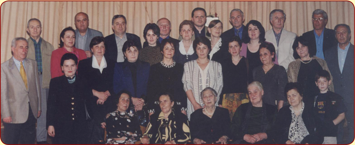
დგებუაძეების გვარის შეხვედრა. ქ. თბილისი, 2002 წლის 8 ივნისი.