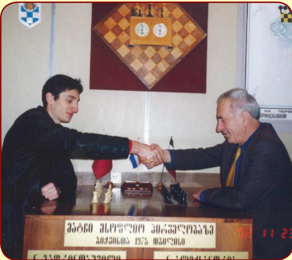
შეხვედრა გროსმაისტერ ბ. ჯობაჯასთან. 2003 წ.