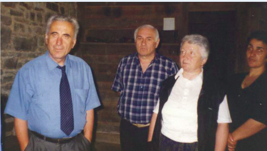
სიღნაღის რაიონი, ბოდბისხევი. 1999 წ. სექტემბერი