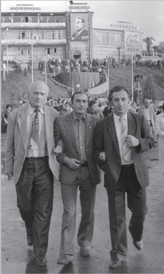
ქართველა და აფხაზეთა მეგობრობის ზეიმი რუხში

«ქართული შხარის დამარცხების განმსაზღვრელი ფაქტორი და მიზეზი იყო ეროვნული ერთიანობის უწყონლობა, შიდადაპირისპირება და გათიშულობა, მავრამ ასე თქმა ცოტაა. ჩვენი აფხაზეთში დამარცხების მთავარი (თუ უმთავრესი არა) მიზეზი იყო ღალატი, საკუთარი ხალხისა და ქვეყნის მიმართ ღალატი, თრთიერთღალატი და საერთოდ ღალატი ელემენტარული ადამიანური ჰრინციჰებისადმი».