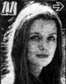
პარსონაჟი „სამ მუშაკარში“