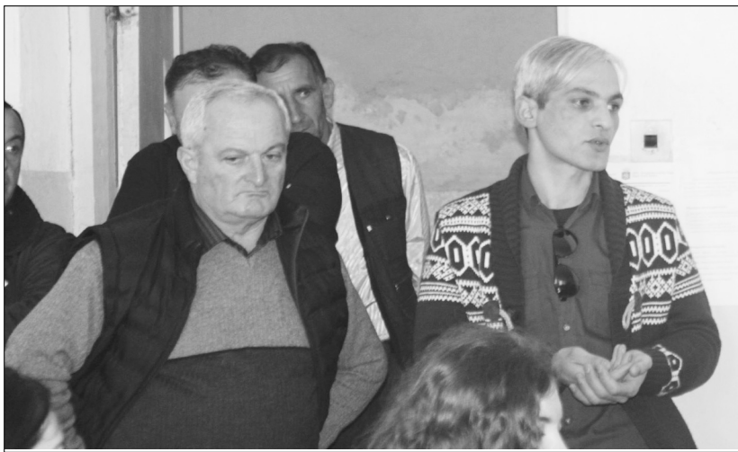
ფლის გაზიფიცირება დაასახელა. სოფელ სილაურისთვის ერთ-ერთ პრობლემას მდინარე სუფსა წარმოადგენს. მდინარე სუფსამ სოფლის სავარგულების 20 პროცენტი უკვე