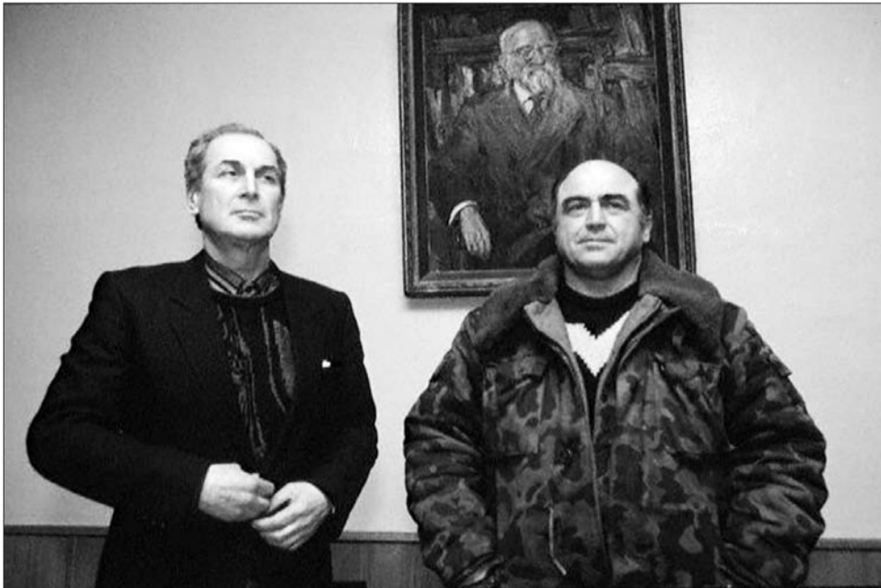
საქართველოს რესპუბლიკის პრეზიდენტი ზვიად გამსახურდია ქ. თბილისი. 1991 წლის 22 ნოემბერი.

პროფესიული კავშირების უფლებათა უზრუნველყოფისა და მათი საქმიანობისათვის პირობების შექმნის მიზნით ვადაგენ: