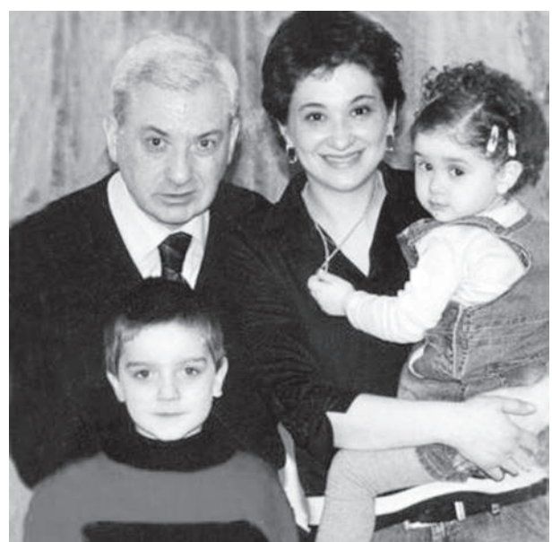
ვიმედოვნებთ, რომ რუსუდან შარაძის შემთხვევაში, ანალოგიები შეუსაბამოდ გარდაიქცევა და სააკაშვილის რეჟიმის დასრულებისთანავე,

უახლესი და ძველი ისტორიების მწარე გაკვეთილებიდან კი ვუწყით, რომ პოლიტიკური იმედები, რომ ისინი, ადრე თუ გვიან აუცილებლად დაბრუნდებოდნენ საყვარელ სამშობლოში, არასოდეს ამხდარა და უცხოებაში, სამშობლოზე ფიქრით და ტანჯვით განლულან.