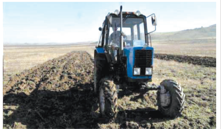
ნაკვეთის პროპორციული ქულების რაოდენობა 1 ჰექტარზე 140 ლარის გადაანგარიშებით.