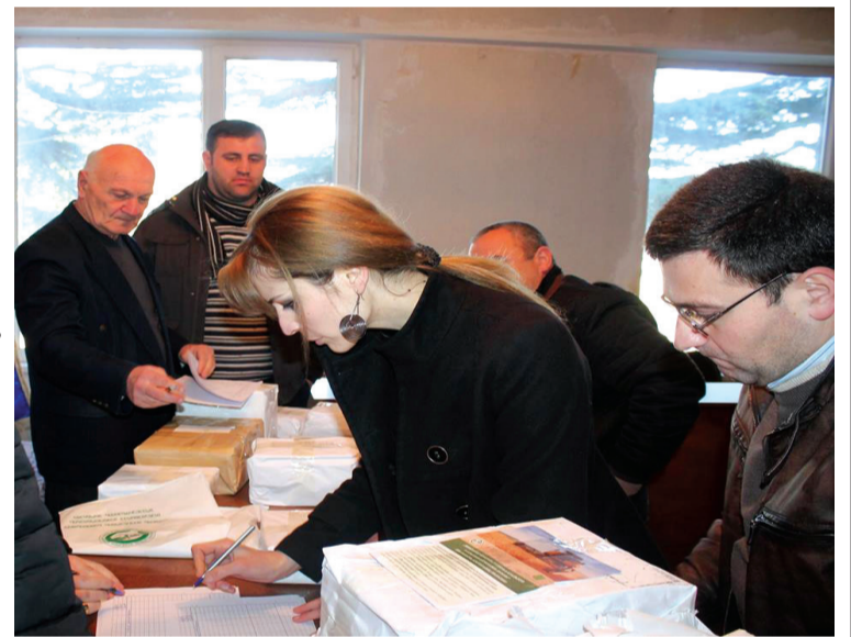
მიწა შემოდგომით დაამუშავებს, შესაძლებლობა აქვთ ჩააბრუნონ ხვნის ბარათები, რომელსაც მიენიჭება შესაბამისი კოდი და დაერიცხებათ

2013 წლიდან სოფლის მეურნეობის სამინისტრო აწარმოებს მცირემიწიან ფერმერთა დახმარების ხელშეწყობის პროგრამას. წელსაც გაგრძელდა აღნიშნული პროექტი, რომლის მიზანია დახმარება გაუწიოს მცირემიწიან ფერმერებს, მათ, ვისაც საკუთრებაში აქვთ 125 ჰა სახნავი და მრავალწლიანი ნარგავები. აღნიშნულ პროექტში წარმატებით ჩაებნენ ხაშურის მუნიციპალიტეტის ფერმერები – 2013 წელს-12511, 2015 წელს 14047 ბენეფიციარი. პროექტის პირობების თანახმად, სასოფლო-სამეურნეო მიწების დამუშავებას-მოხვნას აწარმოებს შპს "მეკანიზატორი" და ამხანაგობები. პროექტი გრძელდება 1 დეკემბრამდე, რაც საშუალებას აძლევს ფერმერებს მიწის დამუშავება მოახდინონ შემოდგომითაც. წელსაც გრძელდება აღნიშნული პროექტი. სასოფლო-სამეურნეო ხვნის ბარათები ჩამოტანილია ჩვენს მუნიციპალიტეტში. წელს პროექტში მონაწილეობას მიიღებს 13500 ბენეფიციარი. სოფლის მეურნეობის სამინისტროს და ხაშურის მუნიციპალიტეტის საინფორმაციო-საკონსულტაციო სამსახურის წარმომადგენლებმა ხვნის ბარათები გადასცეს გაბეგვების წარმომადგენლებს ერთეულების მიხედვით, სულ 8868 ბარათი. მათი დარიგება მოსახლეობისათვის დაიწყო, რაც საშუალებას მისცემს მათ მოახდინონ უკვე საგაზაფხულო ხვნის სამუშაოები, ხოლო მათ, ვისაც საკუთრებაში აქვთ 0,25 ჰა-მდე მიწის ფართობი, მიიღებენ სუბსიდიას 50 ქელის სახით. მისი საშუალებით შესაძლებელი იქნება ბენეფიციარებმა სპეციალიზირებულ მაღალიხეობში შეიძინონ ნიადაგის გასანოყიერებელი სასუქი, მსხამ-ქიმიკატები და სათესლე მასალა. ბენეფიციარები, რომელთაც