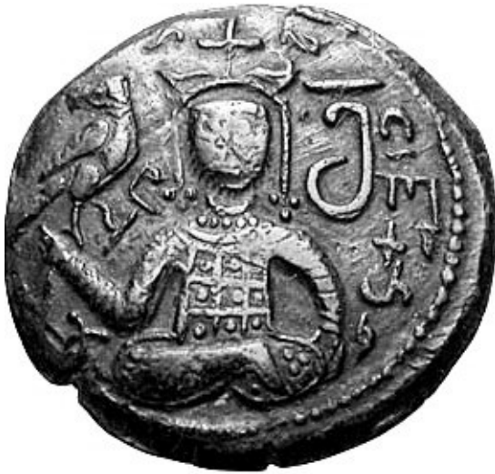
გიორგი III-ის მიერ მოჭრილი მონეტა სპილენძი, ქორონიკონი 394 = (1174 წ).