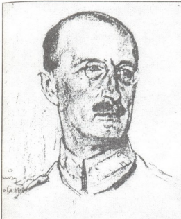
გენერალი ფონ ლოსოვი (აღებულია ი. პომიანკოვსკის 1997 წელს სტამბოლში თურქულ ენაზე გამოცემული წიგნიდან „ოსმალეთის იმპერიის დაცემა“)

„ახალი ყაიდის დიპლომატს“ უწოდებს, რომელმაც გერმანიის კავ- კასიურ პოლიტიკაში ავსტრია-უნგრეთის კონსტანტინოპოლელი ელ- ჩის, მარკგრაფ ი. ფონ პალავეჩინის აზრით, „კომიკური“ ნოტი შეი- ტანა. ლოსოვი თავს თურქ ოფიცრებზე ბევრად მაღლა აყენებდა, ხში- რად ჩხუბობდა მათთან, პოლიტიკას საკუთარ რისკზე აგებდა და გა- მოკვეთილ ანტითურქულ პოზიციაზე იდგა. 26 გ. რიტტერი სინანუ- ლით აღნიშნავს, რომ ბათუმში „სამწუხაროდ, ჯარისკაცი“ მიავლინეს და არა პროფესიონალი დიპლომატი, რომელიც კონფლიქტური იყო თურქებთან და კავკასიაში ჯარების გაგზავნაც მოითხოვა. 27 საქარ- თველოსადმი თურქეთის აგრესიული პოზიციის გაუთვალისწინებლო- ბის გამო, რამდენადმე ცალმხრეობა რიტტერის მოსაზრება, თუმცა გასაგებია მისი დამოკიდებულება ლოსოვისადმი, რომელიც უფრო უმაღლესი მთავარსარდლობის მითითებებით მოქმედებდა და ამდუ- ნად, ეწინააღმდეგებოდა „აუსენამტის“ (საგარეო საქმეთა სამინის- ტრო) „სამშვიდობო პოლიტიკას“. რაიხსმინისტრი რ. ფონ კიულ- მანი, კაიზერული დიპლომატიური კორპუსის „ცივი პროფესიონა-