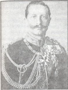
კაიზერი ვილჰელმ II