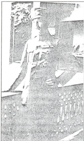
გრაფი ფონ შულენბურგი თბილისში (ჰანს ფონ ჰერვარტის წიგნიდან Zwischen Hitler und Stalin. Erlebte Zeitgeschichte. Frankfurt a/M, 1985 ). მის მკერდზე ჩანს თამარ მეფის ორდენი, რომლითაც იგი დააჯილდოვეს საქართველოს დამოუკიდებლობის გამოცხადებაში განსაკუთრებული დამსახურებისათვის. სურათი უხარისხოა, მაგრამ მაინც ვებუჯღავთ.

ქართველებსა და სომეხებს დიდი და ძლევამოსილი ისტორიული წარსული გააჩნიათ, რის გამოც ისინი არაჩვეულებრივ სიამაყეს განიცდიან. ქართველები კავკასიურ რასას მიეკუთვნებიან და მრავალმხრივ გამორჩეულნი არიან დიდი ფიზიკური სილამაზით. მათი ქალები ძალზე სასურველნი იყვნენ მუსლიმანურ პარამხანებში. მე თუმცა ჩემი ნახევარწლიანი ყოფნისას კავკასიაში ძალიან ცოტა ლამაზი ქალი ვნახე, მაგრამ, სამაგიეროდ, ბევრია კარგი შეხედულების მამაკაცი, რომელთა უპირატეს გარეგნობას კიდევ უფრო წარმოაჩენს არაჩვეულებრივად მოხდენილი, კოხტა, ნაციონალური ტანსაცმელი. ქართველების ისტორია ალექსანდრე დიდის დრომდე აღწევს, 28 საუკუნეთა განმავლობაში მათ ბევრი მძიმე ბრძოლა გადაიტანეს თავიანთ მე-