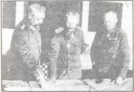
OHL-ის შუფი პ. ფონ ჰინდენბურგი (მარცხნივ) კაიზერთან და ლუდენდორფთან ერთად მთავარბანაკში (სურათები აღებულია წიგნიდან: Deutsche Geschichte in Schlaglichtern, Mannheim, Wien, Zürich, 1990).