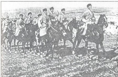
ქართული კავალერია თბილისთან ახლოს 1918 წ.