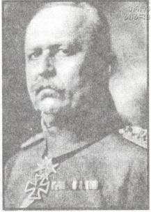
გენერალი ე. ლუდენდორფი