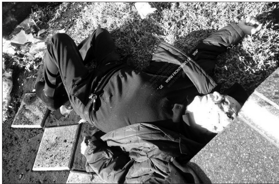
იყო, მაგრამ შემკვეთი არ დასჯილა.

კონსტანტინე ფორჩხიძე: — ვახტანგ ქირია ჩემი ახლობლის ნათესავი იყო. გარდა ამისა, იმ დროს, როცა სამეგრელოში ვმოღვაწეობდი, ძალოვანი უწყების ყველა წარმომადგენელს ერთმანეთთან შეხება, ასე თუ ისე, გვექონდა. როგორც ვიცი, ის უპატიოსნესი ადამიანი იყო. ერთხანობას, როგორც ვიცი, პროკურატურაში აღარ მუშაობდა, შემდეგ კი, ისევ დაბრუნდა. იმის თქმა, რეალურად რა მოხდა, ვერ მჩნევია და ყველაფერი, ალბათ, უახლოეს დღეებში გაირკვევა, მაგრამ ის, რაც მოხდა, თავისთავად ამაზრზენია, რადგან საგანგაშოა, რომ ხელს უკვე პროკურატურასა და, საერთოდ, ძალოვან უწყებებზე წევნი! ასეთი ფაქტი პროკურორ მიხეილ ქურდაძის მკვლელობის შემდეგ აღარ მომხდარა და იმ დღიდან ორ ათეულ წელზე მეტი გავიდა. მომხდარზე რეაქცია, პირველ რიგში, ხელისუფლებამ უნდა მისცეს. ისე, ვფიქრობ, ის რეაქცია, რომელიც მთავარ პროკურორსა და შს მინისტრს ჰქონდათ, სწორი და აბსოლუტურად ადეკვატური ნაბიჯი იყო.