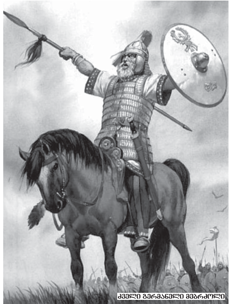
ჰეპელი გერმანელი მებრძოლი