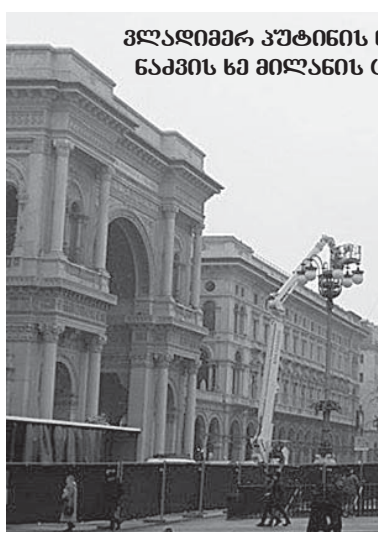
მლანიში პუტინის ნაჩუქარი ნაძვის ხე მილანის ცენტრში

ამ სიკეთით არა მხოლოდ იტალიელებმა, არამედ ჩვენ – სტუმრად ჩასულმა უამრავმა ადამიანმაც ვისარგებლეთ! ანტონიო რუბენის „იესოს დაბადება“ მილანის მუნიციპალიტეტის დიდ დარბაზში იყო გამოფენილი და სპეციალურად დამონტაჟებული განათებით ისეთი ფონი იყო შექმნილი, თითქოს იესოს დაბადების თვითმხილველი, სიხარულის გამზიარებელი და შემდეგომ მისი ჯვარზე გაკერის თანამონაწილე ხდებოდი... შინაგანად გაზრდილი, სავსე და ამდლებული განწყობით ტოვებდა ამ გამოფენების თითოეული მნახველი იქაურობას ისევე, როგორც მე და ამ ემოციებს როგორც შეგვეძლო, ისე ვუზიარებდით ერთმანეთს... „დუომოს“ მილანის მოედანი