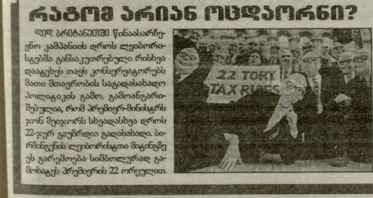
ფორმინფინცი წინასაბრეკის პრეგრადის ფორმინფინცი წინასაბრეკის პრეგრადის ფორმინფინცი