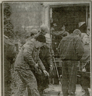
ამ რაზმების დღის წიარბ მოსკოვს დადაკავეს კოჩიალიკოვის სასადგომზე მოხდენ ავიტოვების უკუმიმართული დღი დაჯრუბ. არევის სურბონუ შეისხვევას აფეფეფე შეზღუბირ უმინფრე ბას სანსურესის დგა მინფან საქონი სანისტრის დაჯრუბი.