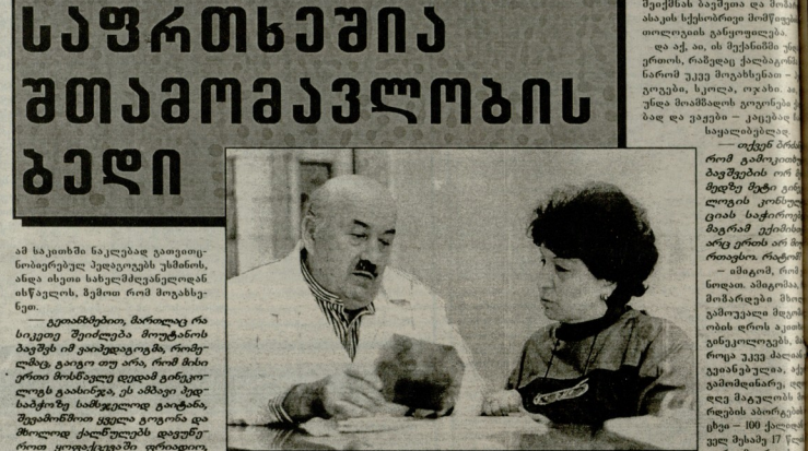
თამარ პრინციპი და ხსენილი პრინციპი...