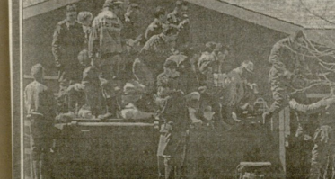
ამისამხე პრეგრადის ფორმინფინცი წინასაბრეკის პრეგრადის ფორმინფინცი