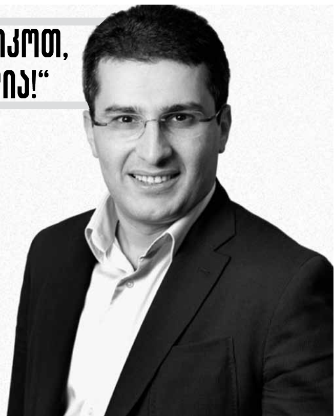
გაკრიტიკოთ და რა ვქნათ ამ შემთხვევაში?

— კეთილი... ცოტა ხნის წინ, საკონსტიტუციო სასამართლომ „რუსთავი 2“-თან დაკავშირებით მიიღო გადაწყვეტილება, რომელიც პირდაპირ მიანიშნებს და აღძრავს სერიოზულ ეჭვს, რომ ეს იყო ერთი კონკრეტული პარტიის ინტერესზე მორგებული გადაწყვეტილება. რა ქნან იმ ადამიანებმა, რომლებსაც ეს გადაწყვეტილება არ მოსწონთ? გასაჩივრებით ვერ ასაჩივრებენ, თქვენ ამბობთ, არ გააპროტესტოთ და არ