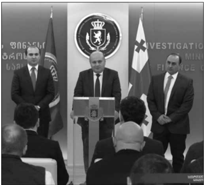
ხოლო უწყების ყოფილი უფროსი ლერი ბარნაბიშვილი ფინანსთა მინისტრის მოადგილის თანამდებობას დაიკავებს.