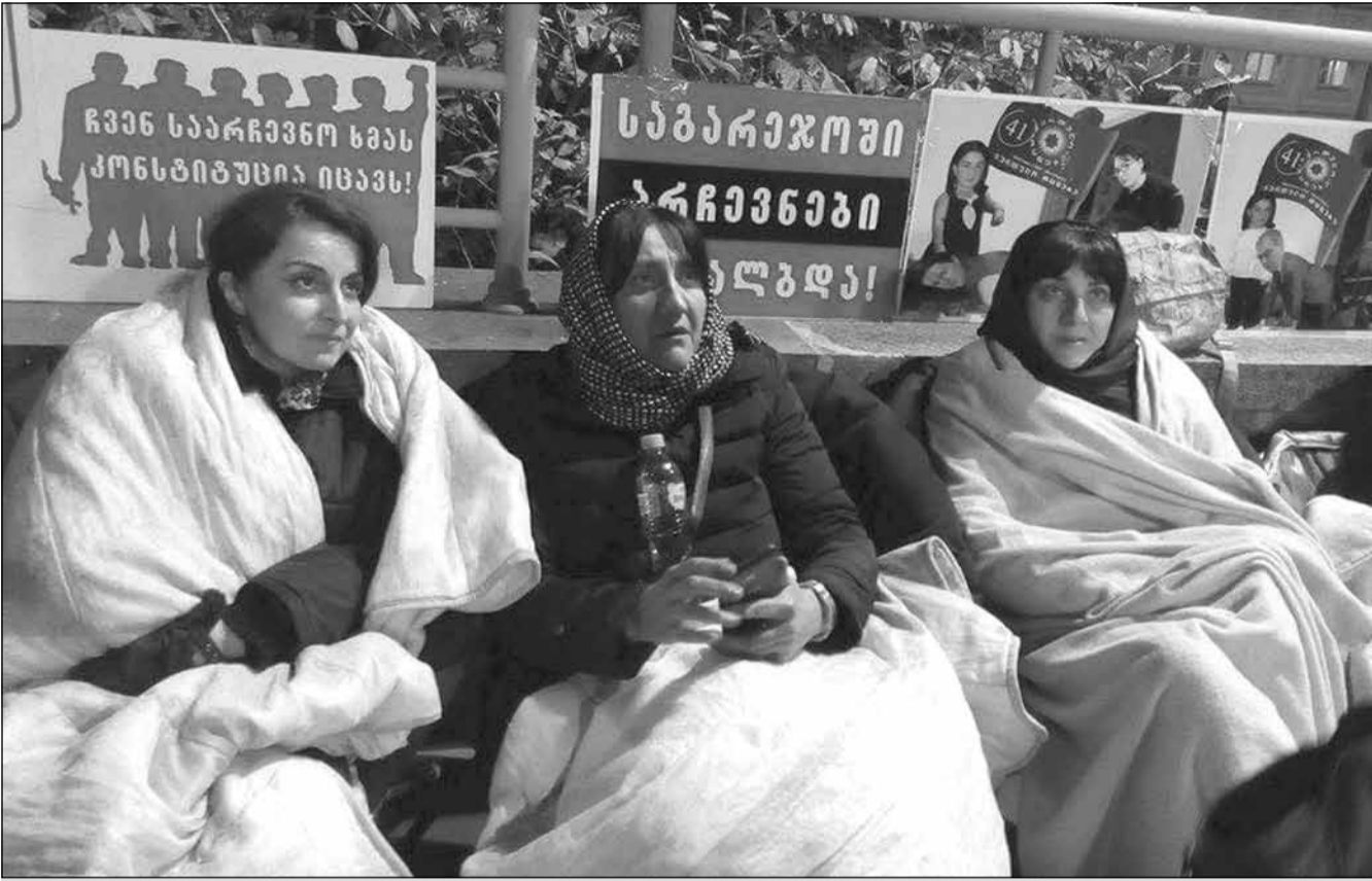
არსებობს თუ არა პატრიოტთა აღიარება და ნაციონალური აქციების გადაკვეთისა და სამოქალაქო დაპირისპირების საფრთხე