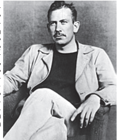
მასალა მოამზადა მანანა მიქელაძემ

▶ ჯონ სტაინბექის ცნობილმა რომანმა „მრისხანების მტევნები“, რომელიც 70 წლის წინ შეიქმნა, დღესდღეობით განსაკუთრებული პოპულარობა მოიპოვა. შეეგახსენებთ, რომ ამ ნაწარმოებში ფერმიდან გაქვევებული ერთი ოჯახის ფონზე დიდი დეპრესიის წლებია აღწერილი. ოპიოს უნივერსიტეტის პროფესორის რობერტ დემოტეს აზრით, რომანში სწორედ ის პრობლემები აღწერილი, რომელსაც კაცობრიობა დღეს, მსოფლიო კრიზისის დროს, ეხლება. „მე რომ ერის დარბევა მსურდეს, ზედმეტად ბევრს მიცემდი. შემდეგ კი დახარბებულს, გასაცოდავებულს და დაავადებულს მუხლებზე დავაჩოქებდი“, — წერდა სტეინბეკი 1966 წელს. პროფესორი დემოტეს აზრით, სტეინბეკი დღეს ცოცხალი რომ იყოს, იტყოდა — ხომ გაფრთხილებდითო.