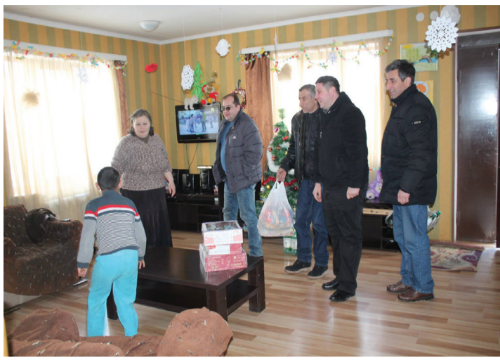
ბითაც მოხდა ეს ქვემოქმედება და ხაშურის ადმინისტრაციულ ერთეულში გამგებლის წარმომადგენლობის თანამშრომლები.

ჩვენს მკითხველს 2015 წელს უამრავი ინფორმაცია მივაწოდეთ იმ ქვემოქმედებების შესახებ, რომელიც ხაშურის მუნიციპალიტეტმა გასწავი მოსახლეობისთვის. ამ კუთხით, გასული წლის დამაგვირგვინებელი აქცია გახლდათ იმ საახალწლო საჩუქრების მთელი ნუსხა, რომელიც გადაეცათ გამყოფი ხაზის მიმდებარე სოფელ წაღვლის ალტერნატიული საბავშვო ბაღის აღსაზრდელებს და მუნიციპალიტეტში მცხოვრებ ოჯახებს, რომლებსაც 5 და მეტი შვილი ჰყავთ. აქციაში მონაწილეობდნენ მუნიციპალიტეტის გამგებელი გიორგი გურასაშვილი, გამგებლის მოადგილე ზურაბ ჩხიტიანი, განათლების, კულტურისა და სპორტის სამსახური, რომლის ინიცირებითაც მოხდა ეს ქვემოქმედება და ხაშურის ადმინისტრაციულ ერთეულში გამგებლის წარმომადგენლობის თანამშრომლები.