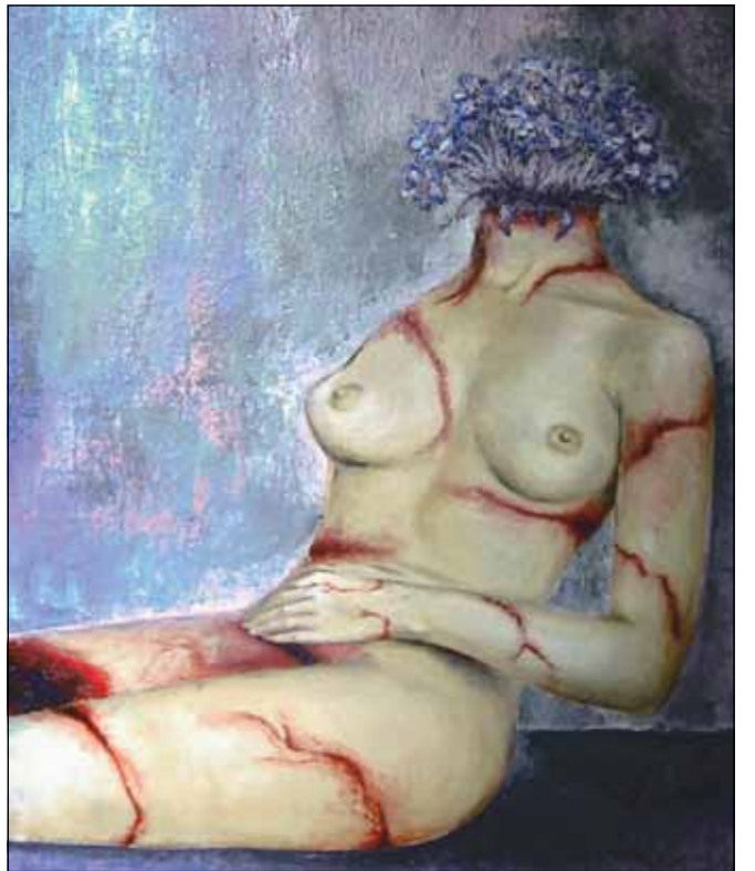
გებისას განაცხადა: „არის ერთი სამწუხარო ამბავი, წმინდა ილია მართლის უნივერსიტეტში არის გამოფენა, სადაც გამოსახულია ყოვლადწმინდა ღვთისმშობელი, უჭირავს პისტოლეტი და თავს იკლავს. ეს არის შეურაცხყოფა ჩვენი სარწმუნოებისა და საქართველოსი. მე მიკვირს, როგორ დაუშვეს ასეთი მკრეხელობა რექტორმა და პროფესორ-მასწავლებლებმა. ასეთი შეურაცხყოფა ჯერ არ ყოფილა საქართველოში. საქართველო არის ნილხვედრი ღვთისმშობლისა და იმედია, გამოსწორდება“.