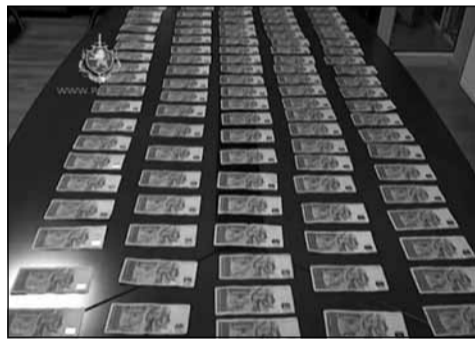
ნარეობს (საქართველოს სსკ-ს 223-ე პრიმა მუხლის 1-ლი ნაწილით და 181-ე მუხლის მე-2 ნაწილის „ა“ და „გ“ ქვეპუნქტით).