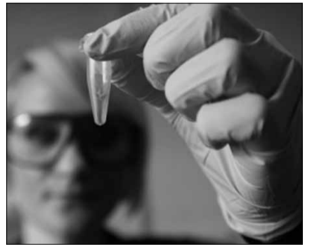
საფრანგეთის პოლიციამ, დნმ-ის ანალიზით, საიუველირო მაღაზიის მძარცველი იპოვა, რომელმაც წასვლის წინ მძვეალს ლოჯაზე აკოცა. როგორც ერთ-ერთი ფრანგული გამოცემა წერს, შარშან ბოროტმოქმედებმა საიუველირო ბუტიკის თანამშრომელი მძველად აიყვანეს, საკუთარ სახლში წაიყვანეს, დააბეს, წყალი გადაასხეს, უთხრეს, რომ ეს ბენზინი იყო და დანვით დაემუქრნენ, თუკი მათ მოთხოვნებს არ შეასრულებდა. ყაჩაღებს სიგნალიზაციისა და სეიფების კოდები უნდოდათ, სადაც ძვირფასეულითა ინახებოდა. მერე ერთ-ერთი მათგანი ბუტიკში „საქმზე“ წავიდა, მეორე კი მძვეალს დარაჯობდა. წარმატებული რეიდისა და მოთმინებისთვის, გოგონამ მძარცველის კოცნა დაიმსახურა, თუმცა გათავისფლებისთანავე პოლიციაში წავიდა, სადაც დეტექტივებმა მისი ლოკიდან დნმ-ის ანალიზი აიღეს. შედეგად დამნაშავეთა ბაზაში ადვილად გამოფრეს მძარცველი და დააკავეს.