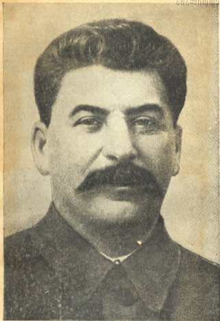
ი. ვ. სტალინი