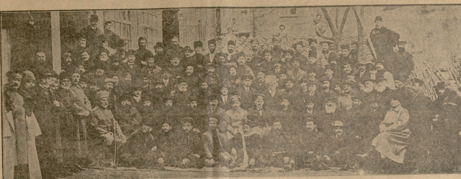
სახეობის კომპარტიზმთა კავშირის დაფუძნებულ კრების მონაწილენი

სამ. მ. — ლი. არც კი ვაძლევ სასულიერო სასწავლებლებში და სემინარიებში გალობის კარგად დაყენებას; განა არ ვიცი, რომ ეხლა, როცა სემინარიამ ყველა უფლება მოიპოვა, გინახებინოს, აღარაინ არ წავა მღვდლთა; ამ შვიდწლიანი სემინარიიდან ორი ქართული წავიდა მღვდლთა და ერთიც ბერძენი. მოწვევ, გადადის თუ არა მეოთხე კლასში, მაშინათვე სტუდენტის ქუდს აკეთებენ; ამიტომაც არის, რომ მეოთხე კლასის 60—70 კაციდან 6—8 კაცი გადადის მეექვსეში, დანარჩენები მიიღიან რუსეთისკენ. იქნებ გგონიათ, ან ის ექვსი ვაჟი მიდიოდეს მღვდლთა? ნურას დროს ნუ იფიქრებთ მაგას. ესენიც ზოგი მასწავლებლად მიდის, ზოგიც სამსახურში შედის ხელმწიფეობისა გამო. მამ ქართველი ეკლესია უმოსამახროთა რჩება?—კითხვას გაოცებული მკითხველი; აქ მივდივით იმ დაწესებულებებს, რომლებიც მღვდლობას ისე ურჩებენ, როგორც ჰიან ტყემალს. მღვდლობისთანა ადვილი და იაფი ეხლა აღარაფერია. რათ გინდა ან სემინარიის გათავება, ან სასწავლებლისა. მიდი ვგრეთა წოდებულ სამღვდლო კომისიაში ან ნაცვლობით, ან მეგობრობით და საქმე გაიხალხლია. ხოლო იცოდეთ კი ცოტა ოდენი წესი მღვდლომსახურებისა და მღვდლის ფორმის წინ არა უდგია რა; არც ვაღობის ცოდნა საჭირო, არც სამართო წერილისა, არც სახარება-სამოციქულოს კითხვისა; ამისთანა მღვდლებით აივსო ჩვენი ქვეყანა; მიზანდანი რომელ სოფელშიც გნებავთ, თუ იქ არ წირვის, ან ვაღობას, ან სსოთან კითხვას