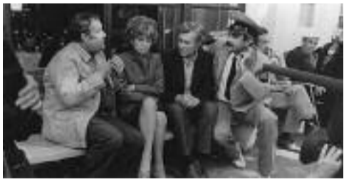
„ძალიან უყვარდა ქართველები და რუსეთ-საქართველოს ურთიერთობის უმძიმეს პერიოდშიც კი თავის სათქმელს ამბობდა“