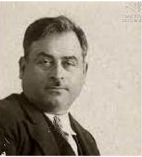
სიყვარული რუსთაველის ბაბბბბი

ქართული იდეოლოგია მრავალ მიზეზთა შედეგია. სიყვარული და ექსტაზი, რომელსაც ქადაგებს რუსთაველი, საქართველოს გრძელი ისტორიის პულსაციას გამოსახავს. რუსთაველის მიჯნურობა იდეალური ფორმა ბრძოლის სოციალური ფსიქოლოგიისა, რომელიც ვითარდებოდა წარსულში ქართული კულტურის ისტორიული დეტერმინაციით; მიჯნურობის იდეა ისეთივე ექსტრემულია ქართული სოციალური განცდისა, როგორც ბარათაშვილის თავგანწირული მარტირული განსჯისა, რომელიც სიყვარულითა და მრწამსით უკუღმარებელია და „ხვეწა-კოცნა, მტლაშა-მტლაში“. „მშუღს უფლო სიყვარული“ – ამბობს რუსთაველი. უფლო სიყვარული, რუსთაველის წარმოდგენაში, ნიშნავს უექსტაზო სიყვარულს – სიყვარულს, რომელიც ადამიანი არ იწყებს გატაცებას და ერთგვარ სიყვარულს. რუსთაველი წინააღმდეგობას იძისა, რომ ადამიანს „დღეს ერთი უნდეს, ხვალე სხვა“, სიყვარული ყოველთვის სავსე უნდა იყოს ექსტაზის გრძობით; სიყვარულის ობიექტი ხშირად არ უნდა იცვლებოდეს. ეს ორი დებულება სიყვარულის ფსიქოლოგიისა შორეულ ტრფიალებას მოითხოვს: „შორით ნება, შორით კვდობა, შორით დაგვა, შორით ალვა“ (27) – აი, მიჯნურობის რეალური არსი.