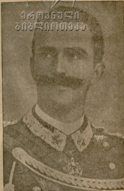
მეფე ემანუელ III, იტალიის მეფე.