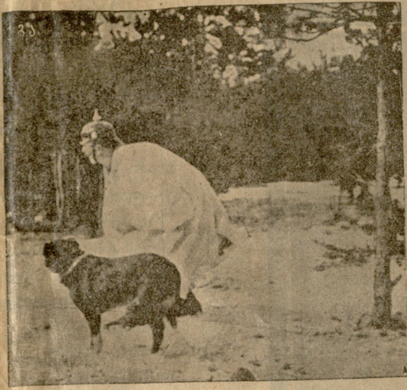
გერმანელი მზვერავი თავის მზვერავ მეძებრით.