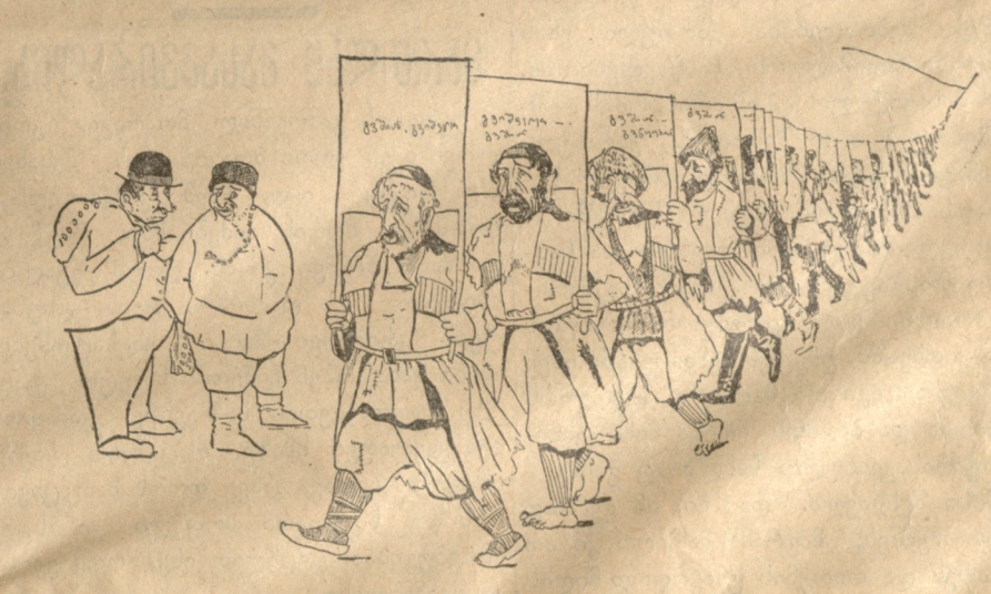
— გვშიანი გვშიანი! — ვაა!

ნავს რომ ეს სიტყვა მხოლოდ დეკლ- მატიაო. ფარჩაშ ნაშქაშქა ესევე იყო, რუსის გენერალ-ლეიტენანტე დაამტკიცა საქმით. დეკემბრის დასაწყისში ჯარებს თავი მოუყარეს ყარაურგანთან, სონა- მერსა, ხოროსანსა, მეჯინგერსა და სა- რაყაშითან. ენვერმა განიზრახა ამ არ- მიის მოწყვეტა, რომ ყარისა და სარი- ყაშიის შუა შეპრილიყო, და რუსის ჯარებს ზურგიდან მოქცეოდა. ამ მიზნით ოსმალთა ჯარები თავისუფლად ნებდე- ბოდნენ, უკან-უკან იხევდნენ და რუსის ჯარებს ოსმალების შიგნიდან იტყუებ- დნენ. იმავე დროს მეორე ფრთა მოი- წვედა ოლითსა, ბარლესსა და სარი- ყაშიისკენ. პირველი მათი ნაბიჯი, მარ- თლაც, მათთვის ხელსაყრელად მიდიო- და. მათ ძალას წინააღმდეგობა ვეღარ გაუწიეს და 9 დეკ. დასტოვეს იდა, იო- ტეს ოლითის ჩრდილოეთით. ოლითის გამარჯვება ოსმალებმა მეტად გააზვია- დეს. ასევე გამარჯვებს ბარდესზე. ენვე- რი საქმეს მოგებულად სთვლიდა. გათა- მამებული თავის ბრძანებაში წინდაწინვე დალუბულად აღიარებს რუსთა მეცხრე და მეათე კორპუსებს. მის ღრმა რწმე- ნას იზიარებდა ფონ-შელენდორფიც. 12 დეკ. ენვერიც და უსეც საქმეს სრულიად მოგებულად სთვლიდნენ და წინდაწინვე იყოფდნენ იმ დათვის ტყავს, რომლის ბრჭყალების სიბასრე ასე სავრძინებელი იყო მთელი მათი განადგურებული არ- მიისთვის. (რუს. სლ.)