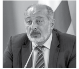
ლემბით, დღეს ნორჯი ჩანს, რატომაც: ჯინაშკარ-ხიზულას ამზადებდით, თქვენს სულს თუ უსულობას შეუკურთხა სატანამ.

უსულობით დამპლემო, კი არ დაგვიწყებია თქვენი მაშინდელი ჭორები, მოსკოვამდე და ვაშინგტონამდე რომ გაგქონდათ და გამოგქონდათ, ზვიად გამსახურდიამ კათალიკოს-პატრიარქს უბრძანა, სვეტიცხოველში მეფედ უნდა მკურთხეო. ასეთ ხმებს რომ აგრე-