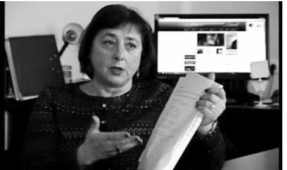
ნლის ნინ მოსმენის ნაწილის ტექსტები ძალიან მარტივი იყო. აბიტურიენტებმა, თითქოს და, დაგვიჩინეს კიდევ – ძალიან მარტივი ტექსტები იყვნენ?! მართლაც მარტივი იყო, რადგან დაწყებით ეტაპზე მოსმენის დავალების შემოტანა, თავისთავად, გარკვეული სირთულე იყო. წელს ტექსტები გართულდება და ადეკვატური სირთულის იქნება – მარტივი B1, რაც ზუსტად შეესაბამება ეროვნული გეგმის მოთხოვნებს. B1 საშუალო დონეა, საერთაშორისოდ აღიარებული ნორმებით. უფრო სწორად B1-, ანუ მარტივი B1. 10 დავალებაში შეიძლება იყოს 2-3 მარტივი, 2-3 საშუალო სირთულის, მაგრამ საერთო ჯამში, წინა წლებთან შედარებით, სირთულე მეტი იქნება.