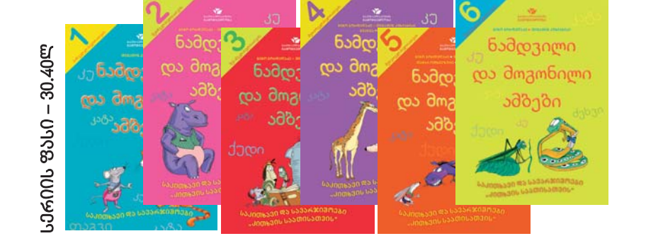
სპირიტის ფასი - 30.40ლ

საკია „ნაშეილი და მთომილი აბეაი“ შაქმინია I-VI კანსახის მონაწილანისათვის, „კითხვის საათის“ საკითხიან მათაინისწინააღმდეგობით. წინააღმდეგობით: სანსილი კატიომეაი, მარტივი ინსტრუქციანი, ასაკისთვის შესაბამისი ანით დაწერილი საბავშვო ტექსტები, რაც დახმარება კანსის დაწინააღმდეგობა თუ მთომეაი, მათემატიკის ბავშვის წარს, კითხვისა და მათემატიკის უწარ-რეაბილიტაცი.