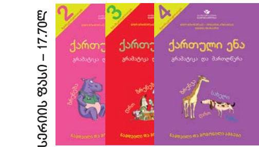
სპირიტის ფასი - 17.70ლ

ქართული ანის კრებული აჩოპანი სანჯანო მამით მათაინისწინააღმდეგობით მრავალთა თაორიანი კარსი და სანაჩაიოთაი.