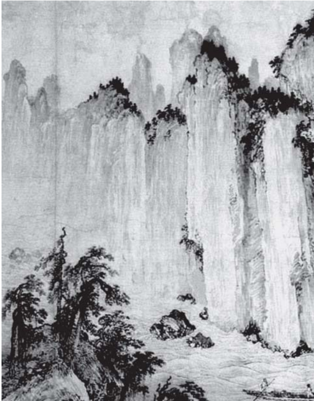
რომ ოდესმე მოულოდნელად ამოაცუროს, დაუვიწყარ თავფურცელივით...

ვინ იფიქრებდა, შუა ქალაქში მოვარდნილ რისხვად და მესაფლავედ იქცეოდა პატარა ვერე და სანყლებს ცოცხლად თუ დამარხავდა?!