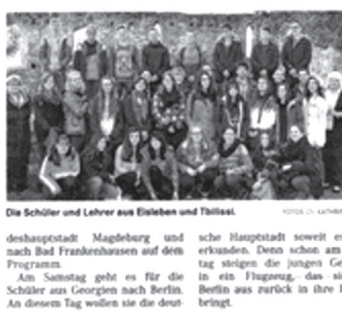
Die Schüler und Lehrer aus Eisleben und Tbilisi.