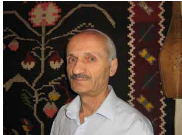
რა ჩონგური, რის გიტარა /ხმა გაკმინდეს მერცხლებმა/- სიჩუმეა იმისთანა, გალობისა შეგრცხვება.

მინა მწირის ჯვალოსავით თბილია და უბრალო. შენ ხარ ჩემი სალოცავი, იისგულა უფალო.