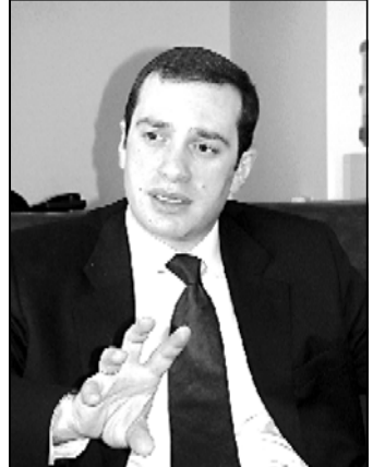
დიდი ხელს გაუნდის სხვა აზრის წარმომადგენელს, ეს ზოგად სისუსტედ ჩაითვლება. ასე სუსტი დადამინები იქცევიან, პიროვნულად და ამიტომაც ვთქვით, რომ სააკაშვილმა არა მარტო პოლიტიკური სხვა, არამედ ადამიანური სხვა დაკარგა, როდესაც მან ასეთი ნაბიჯები გადადგამს.

ჩვენ, მზად ვართ, რომ მუშაობა გავაჩხილოთ და მაისი შეთანხმებებისთვის ბოლომდე გამოვიყენოთ. ეს ჩვენი სუბიექტი და ღირსეულობის განცხადება. სახსრებით მოხარულნი ვართ, რომ „ხიანათი“ და ხელისუფლების წინააღმდეგობის მომხრეების მხრიდან განხილვის ანის თქმის საფუძველზე მაძიებს ის ინფორმაციები, რომლებსაც ვაძიებთ. — განაცხადა, ადვანსიამ. „ჩვენი საქმიანობა — თავისუფალი დემოკრატიის რეჟიმი, იმისთვის, რომელიც ადვანსიამ „ახალ თაობას“ უსაყურად აღიქვამს.