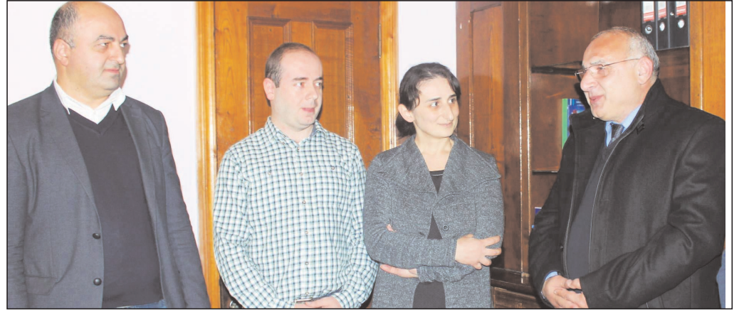
ბულ არჩევნებზე, არასამთავრობო ორგანიზაციებიდან: „ადამიანის უფლებათა ცენტრი“ ( HRIDC ); „სამართლიანი არჩევნებისა და დემოკრატიის საერთაშორისო საზოგადოება“ ( ISFED ) 2010 წლის მარტი: – ევროკავშირის პროექტის – „ახალგაზრდა ევროპელი“ ფარგლებში, ვიზიტი ბრიუსელსა და სტრასბურგში.

ონლაინ გამოცემები: გაზეთი "ბათუმელი" (სამართლისა და ადამიანის უფლებების განხრით); Georgia Today – კორესპონდენტი აჭარაში; ინტერნეტ გამოცემა – tspress – ჟურნალისტი ბათუმიდან; 2006 წლიდან 2014 წლამდე, არასამთავრობო ორგანიზაცია „ადამიანის უფლებათა ცენტრი“ აჭარის ფილიალის ხელმძღვანელი. 2014 წელს სახალხო დამცველის ოფისთან არსებული პრევენციის ეროვნული მექანიზმის ექსპერტი; 2003 – 2014წწ. – დამკვირვებელი ყველა ჩატარე-