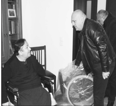
ალიონი. 17 ნოემბერს, ქალაქ ოზურგეთში მცხოვრებმა, შუპ პირებმა სამედიცინო ეტლები მიიღეს. საერთაშორისო ასოციაციის „საქართველოს ქალები მშვიდობისა და სიცოცხლისათვის“ პროექტის ფარგლებში