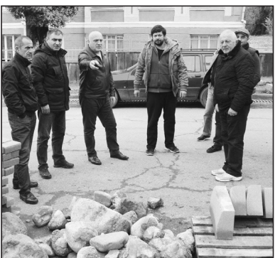
ალიონი. ქალაქ ოზურგეთში მასშტაბური ინფრასტრუქტურული პროექტების განხორციელება დაი-

წყო. ამჟამად ბორდირების კეთილმოწყობისა და ტროტუარების დადგენის სამუშაოები ქალაქის სხვა ქუჩებზე გადინავდება. ტროტუარებისა და ბორდირების კეთილმოწყობა დოლიდის, ერისთავის, გაბრიელ ეპირსკობისა და თაყაიშვილის ქუჩებზე მიმდინარეობს. აღნიშნულ სამუშაოებს ტენდერში გამარჯვებული კომპანია „ინჟინერი“ ახორციელებს. პროექტის ღირებულება 439 707 ლარს შეადგენს. ქალაქ ოზურგეთში ტროტუარების დადგენა წლის ბოლომდე დასრულდება.