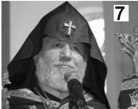
არაჩვეულებრივი გამოცემა ბათუმში